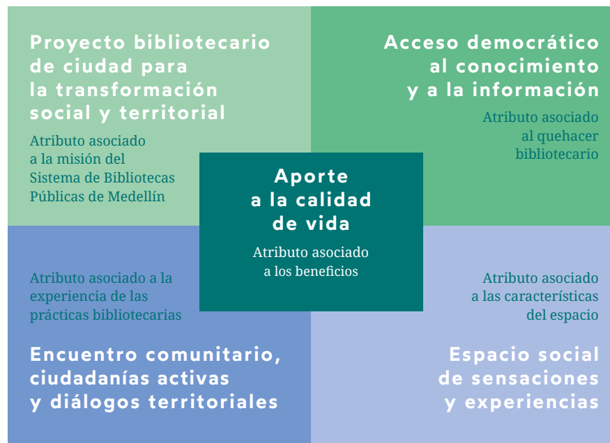
Figura 2. Matriz de dimensiones del valor social del Sistema de Bibliotecas Públicas de Medellín