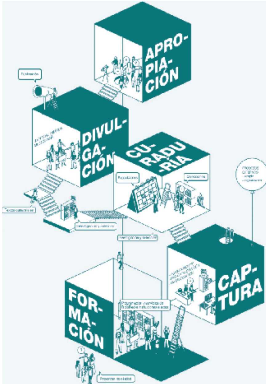
Infografía de flujo de proyectos digitales en BiblioRed (2019).

Para finalizar, nos gustaría dejar sobre la mesa algunas preguntas para guiar la conversación: