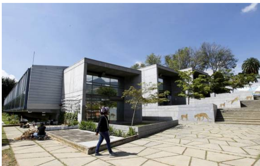
El Parque Biblioteca de San Javier fue el primero que se inauguró. Terminamos con él un recorrido por los nueve que tiene la ciudad.